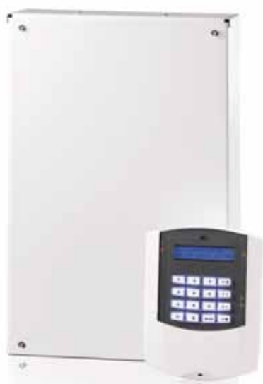
AlphaVision XL centrale met bedieningspaneel